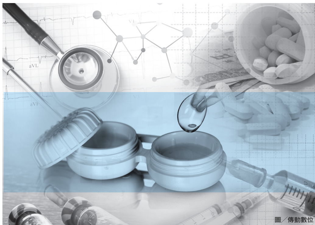
台廠隱形眼鏡連8年維持雙位數增長，是醫療器材業主要成長動能。

值得注意的是，整個醫療器材產業仍屬於入超，醫材進口總值達19億美元，進出口差額達3億美元，有超過5成進口是來自美國、日本、德國的高端醫療設備。🌐