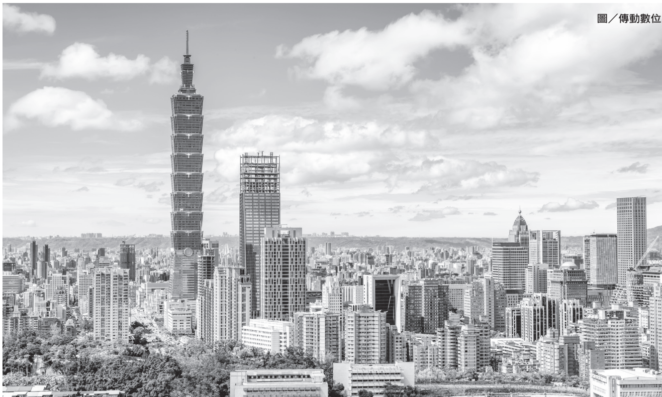
美國傳統基金會第 23 度發布「經濟自由度指數」報告，台灣今年是亞太第 5、全球第 11，排名歷年最佳。