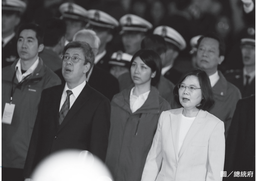
元旦當天，蔡總統與陳副總統出席總統府元旦升旗音樂會，一起齊聲唱國歌。