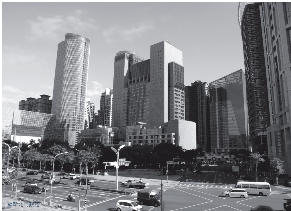
新北市對外交通便捷，通達亞洲各主要城市。圖為新北市政府大樓。

上，可以設計出更安全、節能、舒適的智慧電動車，整合研發部分群聚在新北市新店區，車載資訊周邊廠商座落在汐止