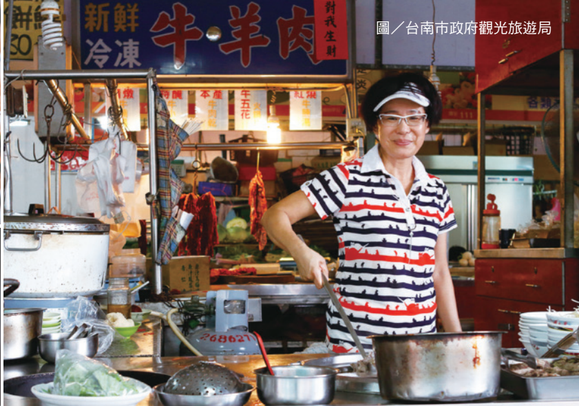
◀▲ 台南是台灣最早開發的地方，多采多姿的小吃文化滿足了無數老饕的味蕾。