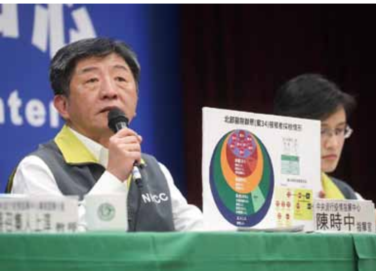
2月27日起中央疫情指揮中心提升至一級開設，衛福部長陳時中擔任指揮官。

息補貼、融資診斷；餐飲、零售、商圈、夜市、傳統市場等紓困振興及內需型產業消費優惠措施等；受疫情衝擊製造業輔導及技術研發補助；徵用口罩生產機台、協助廠商加強出口、開發快速篩檢系統等。