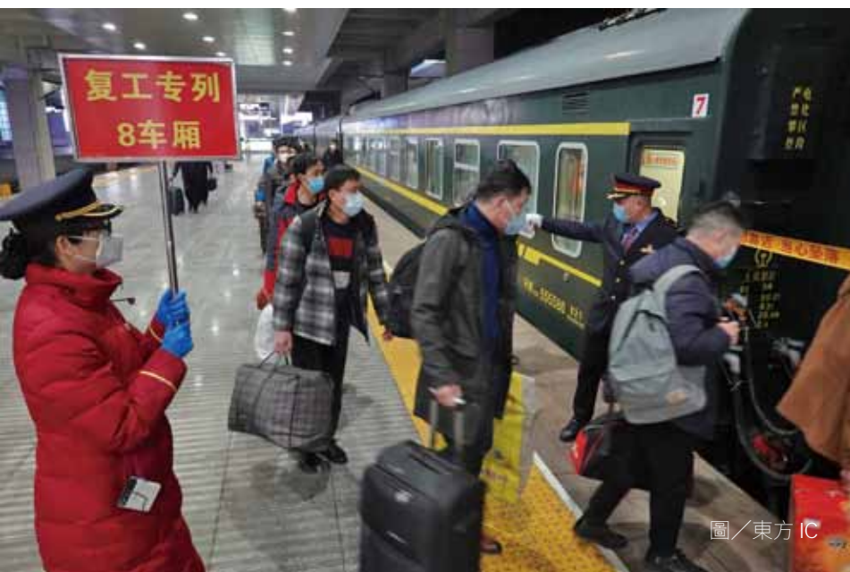
2月29日，民眾在山東煙台火車站，準備乘坐復工專列返回工作崗位。