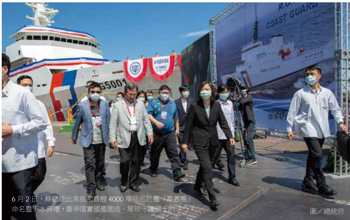
6月2日，蔡總統出席我國首艘4000噸級巡防艦「嘉義艦」命名暨下水典禮，重申落實國艦國造、展現守護國土的決心。