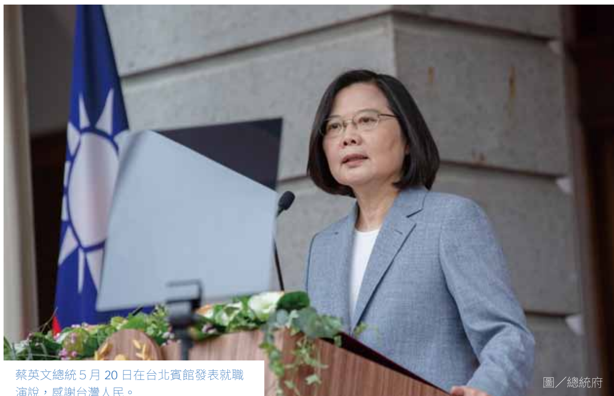
蔡英文總統 5 月 20 日在台北賓館發表就職演說，感謝台灣人民。