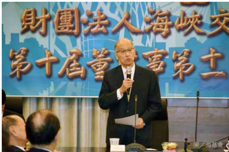
李大維主持海基會董監事聯席會議。