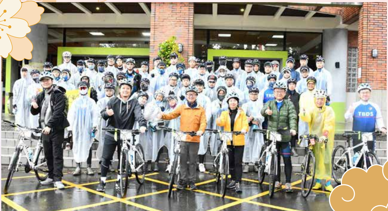
■ 114年3月30日，東莞臺校師生環臺騎行，羅文嘉秘書長為師生加油打氣。

為提供國高中階段之臺商子女深度參與及認識臺灣之機會，114年1月20日至22日，海基會首度舉辦「大陸臺商子女探索營」3天2夜活動，計有40名學員參加。活動包含科學