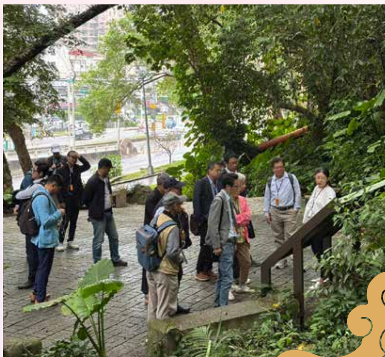
■ 民主和平參訪之旅，圓山飯店西密道導覽。

防重地的歷史脈絡，藉由空間與歷史連結，使民眾理解民主與和平之重要性。此活動亦與社會公民團體進行意見交流，深化公共討論。參與團體包括內湖科學園區發展協會、