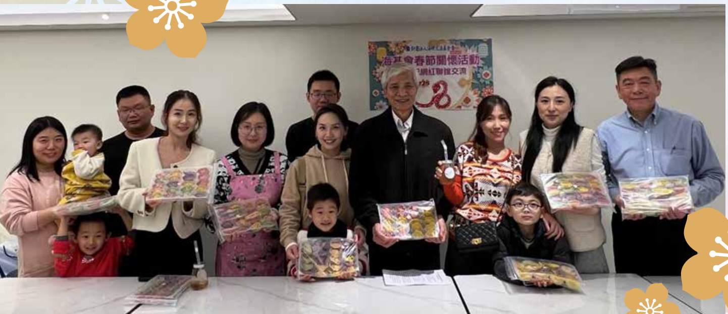
■ 114 年 2 月 21 日，舉辦「陸配網紅聯誼交流」。

為瞭解兩岸婚姻家庭的心聲與需求，海基會持續舉辦關懷活動，以不同形式訪視各地新住民團體及陸配，設法擴大服務網絡。114 年春節，辦理陸配網紅聯誼交流活動；母親節前夕，邀請兩岸婚姻家庭歡度佳節，感謝他們對家庭的付出；中秋節帶領陸配與眷屬走向戶外，到陽明山踏青健行；在周末閒暇之餘，邀請陸配家庭