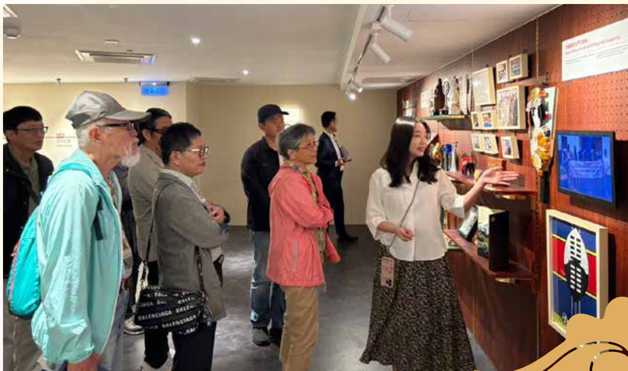
■ 民主和平參訪之旅，參觀中央廣播電臺。