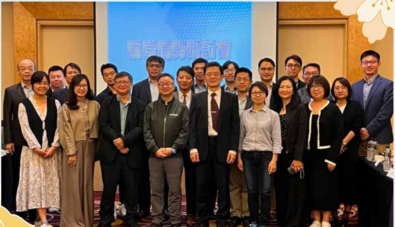
■ 114年11月5日至6日，於宜蘭舉辦兩岸情勢研討會。

為強化與全臺各地學者交流與聯繫，廣納多元觀點與建言，114年11月5日至6日於宜蘭舉辦兩岸情勢研討會。會議分兩場次進行，第一場討論「美中情勢變遷與兩岸關係」，第二場討論「中國大陸政經社情與兩岸關係」。因應2025年下半年，兩岸關係呈現高不確定性的複雜局勢，針對美中戰略競合下的互動、國安統戰與涉臺可能之行徑、中國大陸內部的經濟環境剖析、中國大陸灰色地帶戰術與將高科技納入統戰工具等主題，進行廣泛深入探討，計有12位來自國內的相關領域學者專家參與。發言紀要除內部參考外，亦分享相關政府單位作為決策參考。