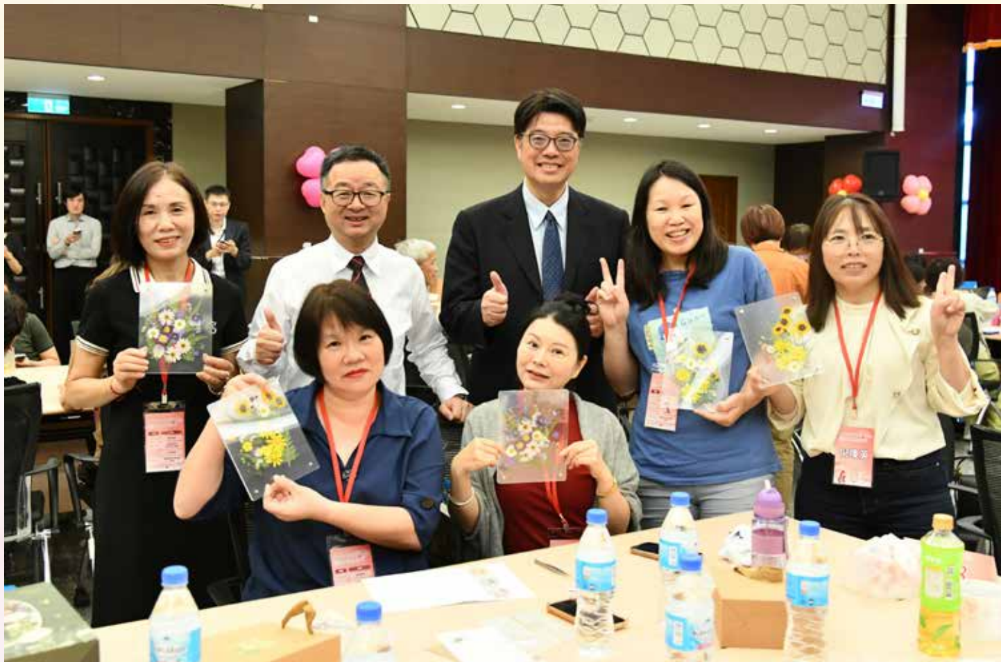
■ 114 年年 5 月 2 日，陸委會與海基會合辦「母親節陸配關懷活動」。

參加「幸福同心 牽手同行」電影欣賞活動；年終赴宜蘭縣關心在地陸配，強化服務深度與廣度。