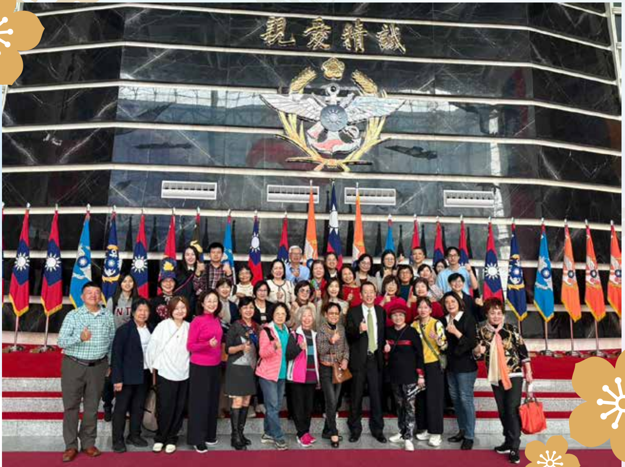
■ 民主和平參訪之旅，參觀國防部。

為增進各界民眾對民主轉型、兩岸情勢及海基會會務之了解，於 114 年度辦理「民主和平參訪之旅」，參訪路線以北安路為軸線，串聯自 1949 年以來做為國