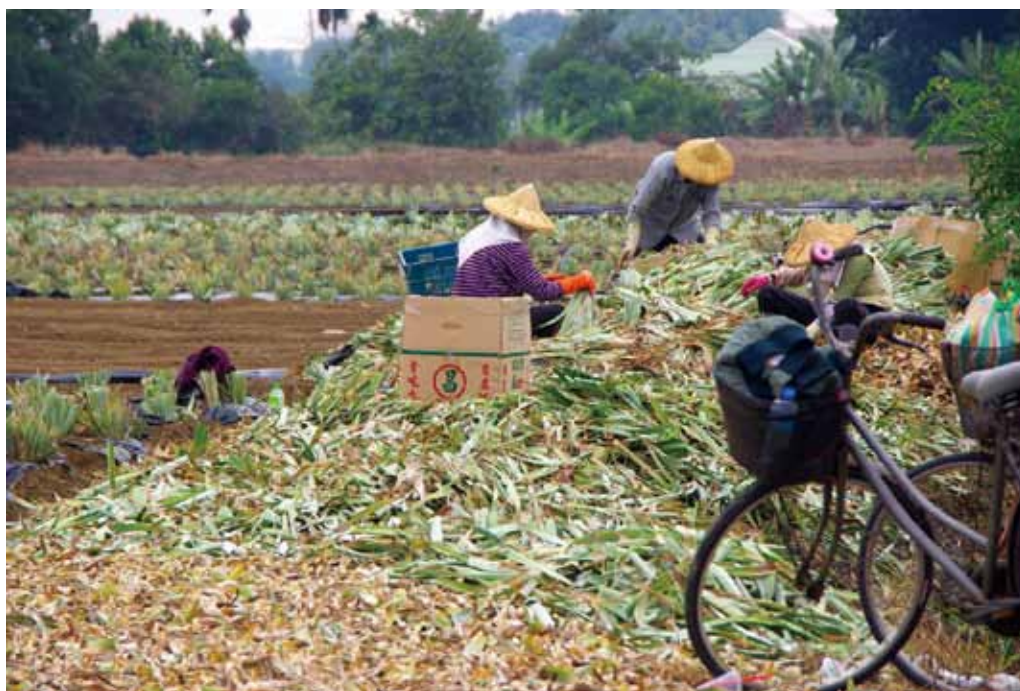
中國大陸發布「農林 22 條措施」，鼓勵臺灣人民及臺資企業赴中投資畜牧水產養殖業，可同等從事林木良種培育，從事農業生產經營亦可申請農業保險保費補貼。圖為嘉義縣民雄的鳳梨田。

因此「農林 22 條措施」的提出，亦是對岸意識到農業人才與糧食自主供應的重要性而有所行動。對此，我政府當有所警覺，務必重視農業人才、技術外流的可能風險，同時亦應維護國內生產供應穩定，確保國人民生安全為優先。企業赴陸投資方面，尤需關注近期中國大陸土地、勞工成本上升，環保訴求趨嚴等現實，做好事前風險評估的功課。🌀