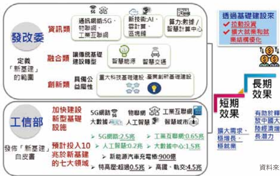
圖 3：中國大陸「十四五規劃」將積極推動「新基建」