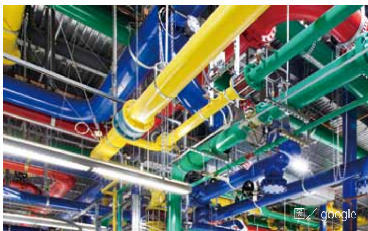
Google 宣布在臺南科技工業區購地，將興建在臺的第 2 座資料中心。圖為資料中心內部照。

全球經貿變遷加上因應新冠肺炎疫情等效應，臺商積極調整全球布局，臺南市政府致力建構優質投資環境，結合中央資源及投資臺灣三大方案，透過投資招商一站式整合服務及資金、研發、行銷等三大輔導策略，同時協助臺商解決問題，或媒合