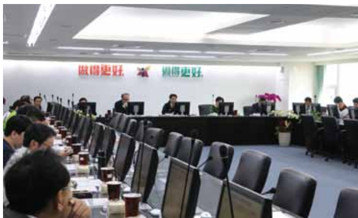
黃偉哲市長親自主持投資會報