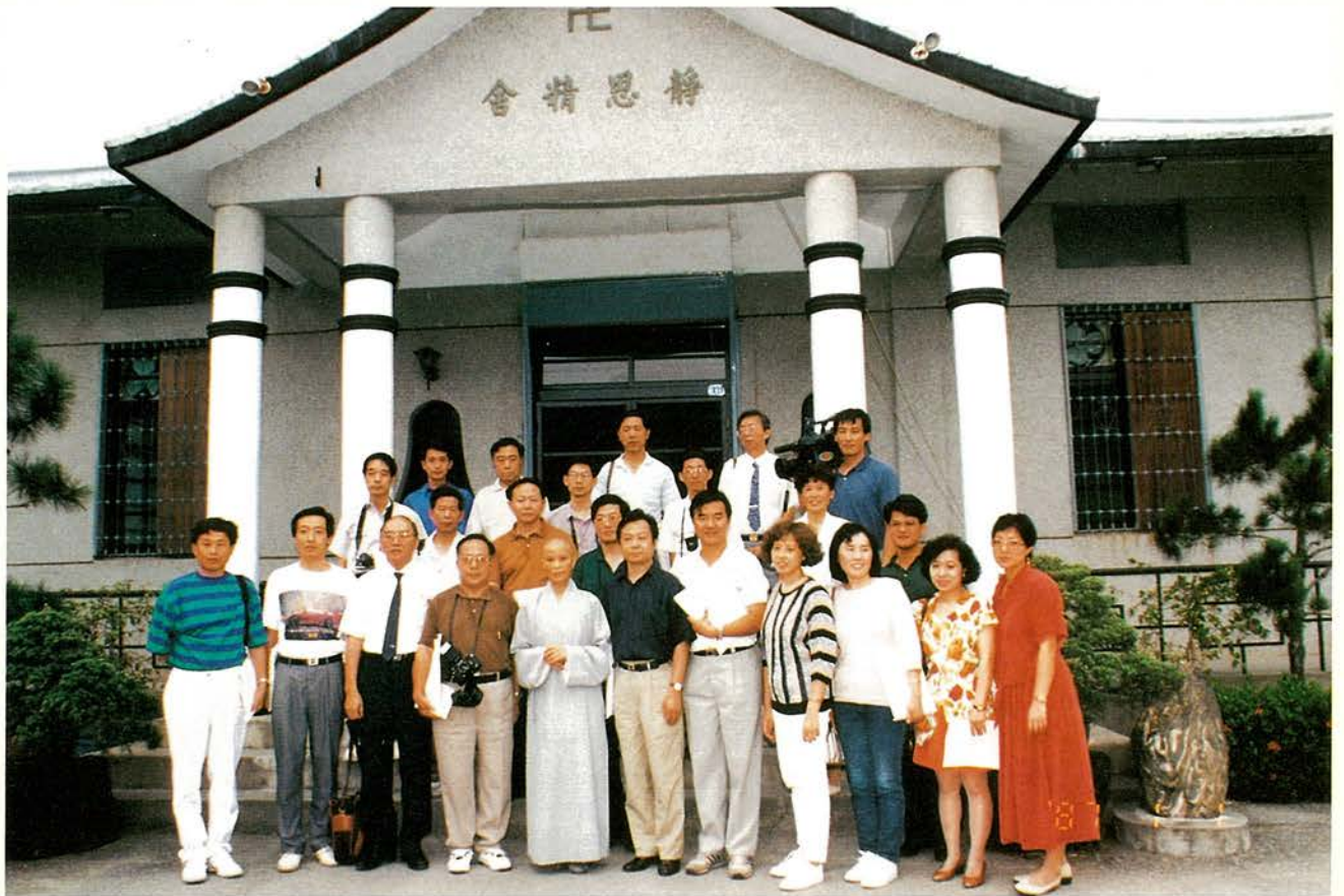
大陸記者訪問團參觀花蓮慈濟醫院，拜會慈濟功德會創辦人證嚴法師。

；參訪高雄港區、對外貿易發展協會，介紹台灣如何結合政府與民間力量共同開發國際市場之努力與成就；參訪彰化縣田尾鄉花卉專業區、台大蘭園、台中區農業改良場、木柵觀光茶園、台北市濱江農產批發市場，介紹台灣農業之精緻化、科技化以及產銷制度；參訪新竹科學工業園區，介紹台灣為求產業升級，引進國外高科技之作法。