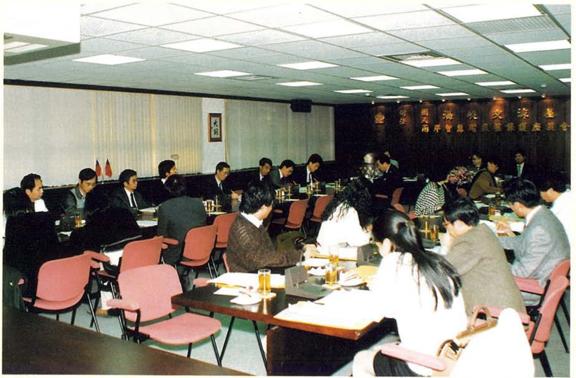
本會舉辦「兩岸智慧產權保護相關問題座談會」。

，即主動予以協助，有關對政府的建議，會後即時彙整轉請各主管機關參採；有關主管機關的答復，本會亦即函送與會業者，至於業者對大陸當局的建議，本會則適時向大陸主管部門反映。