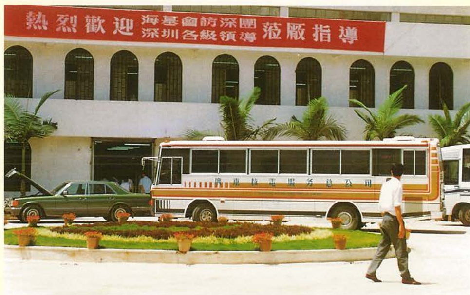
考察團參觀台 資企業達新電 動製品廠。

實業、冠亞手錶等外、台資企業，並遊覽虎門林則徐紀念館。晚間，在東莞賓館設宴答謝當地有關部門，並邀近百位台商參加，在徵得東莞「台辦」同意後，並就地商討籌組台商自律組織。