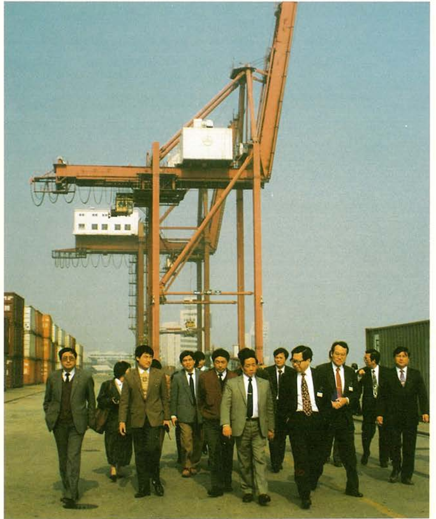
本會經貿考察團參訪「上海港務局」，並參觀張華濱貨櫃碼頭。

廿三日上午，前往中山港出口加工區，聽取簡報，瞭解當地產業發展情形。下午在中山市「台辦」的安排下，參觀翠亨村 國父孫中山先生的故居及紀念館。