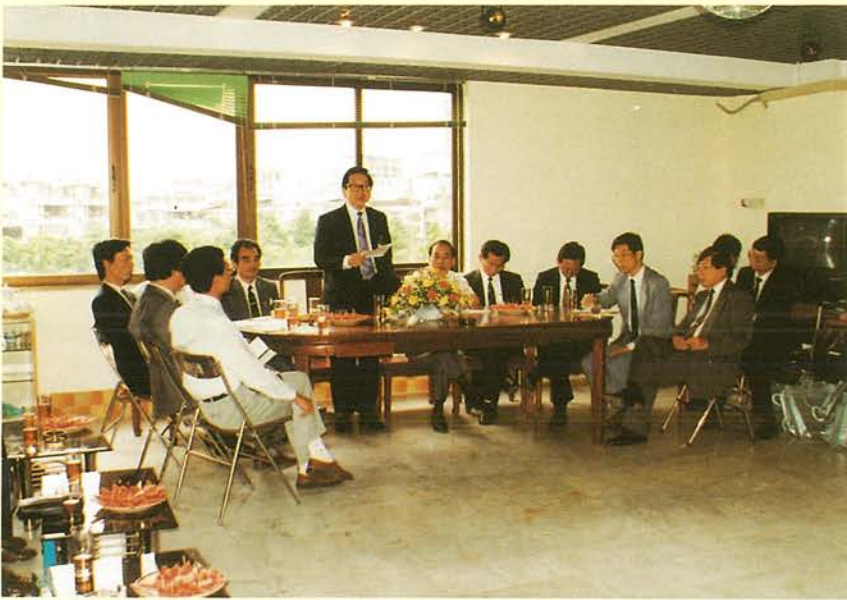
本會珠江三角洲經貿考察團在「深圳台商協會」辦公室，與台商代表舉行座談。

辦兩場次新春聯誼茶會，邀請赴廣東、福建地區投資之廠商參加，計有百餘位業者代表與會，聯誼氣氛熱絡。