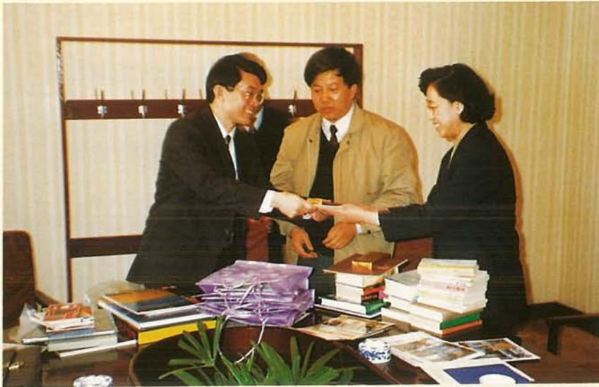
本會組團前往北京蒐集大陸最新資訊，拜訪專業之出版單位。