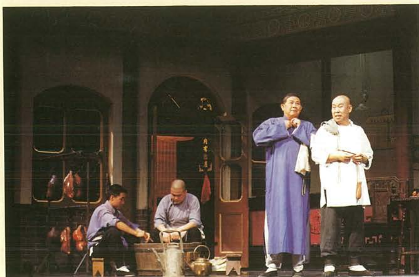
北京人民藝術劇院 演出一景。

區人民進入大陸地區；十一月八日，發布「『台灣地區與大陸地區人民關係條例』施行前進入台灣地區之大陸地區配偶申請居留或定居許可辦法」。