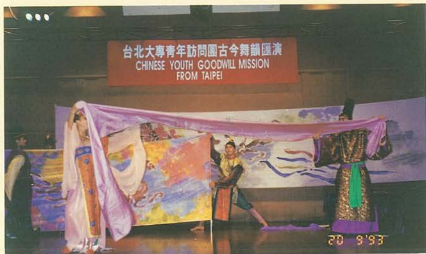
「大專青年訪問團」於澳門表演舞劇。

訪問使兩岸學生有機會從事專業知識之交流，也使台灣學生瞭解大陸農校、科研單位及農村概況，對日後兩岸農業交流有相當助益。