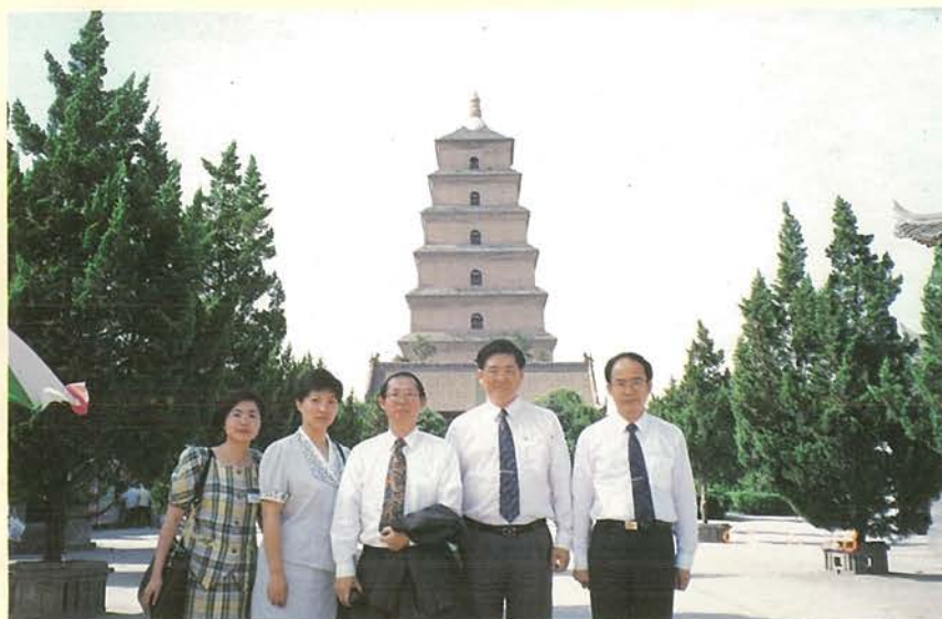
「文化參訪團」於 西安大雁塔前留影

壞，為關懷維護該區文化資產，本會乃於本年三月二十五日與沈春池文教基金會共同籌組「長江三峽文化資產維護考察團」，赴大陸實地考察參訪，台灣地區計有十五位歷史、考古、建築、地質等學者專家參加。