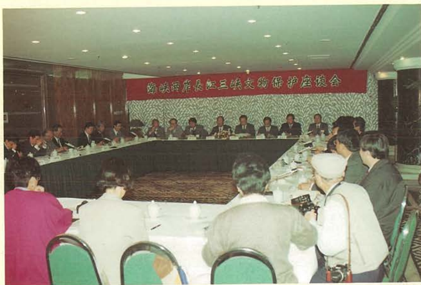
「長江三峽文化資產維護考察團」與大陸「國家文物局」、海協會共同主辦「海峽兩岸長江三峽文物保護座談會」。

本會人員再赴大陸及香港地區蒐購資料，共蒐集文化資產、語言文學、音樂、綜合等四類圖書出版品約五百五十冊。