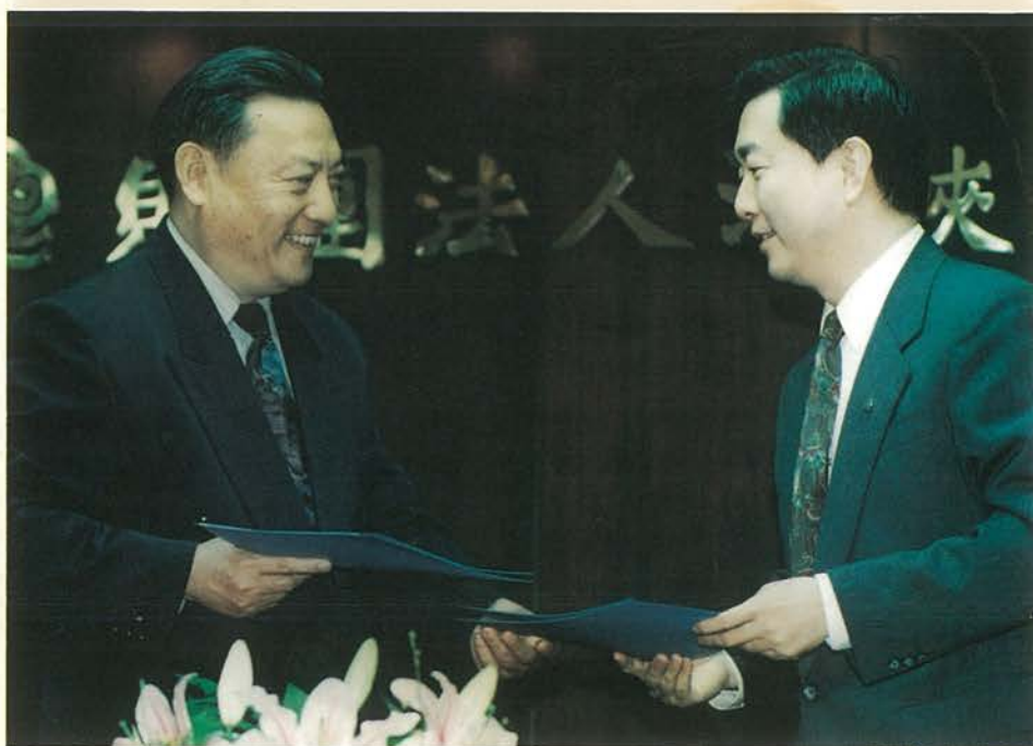
會談結束後，雙方簽署「第二次辜汪會談第一次預備性磋商共識」，並互換簽署文件。