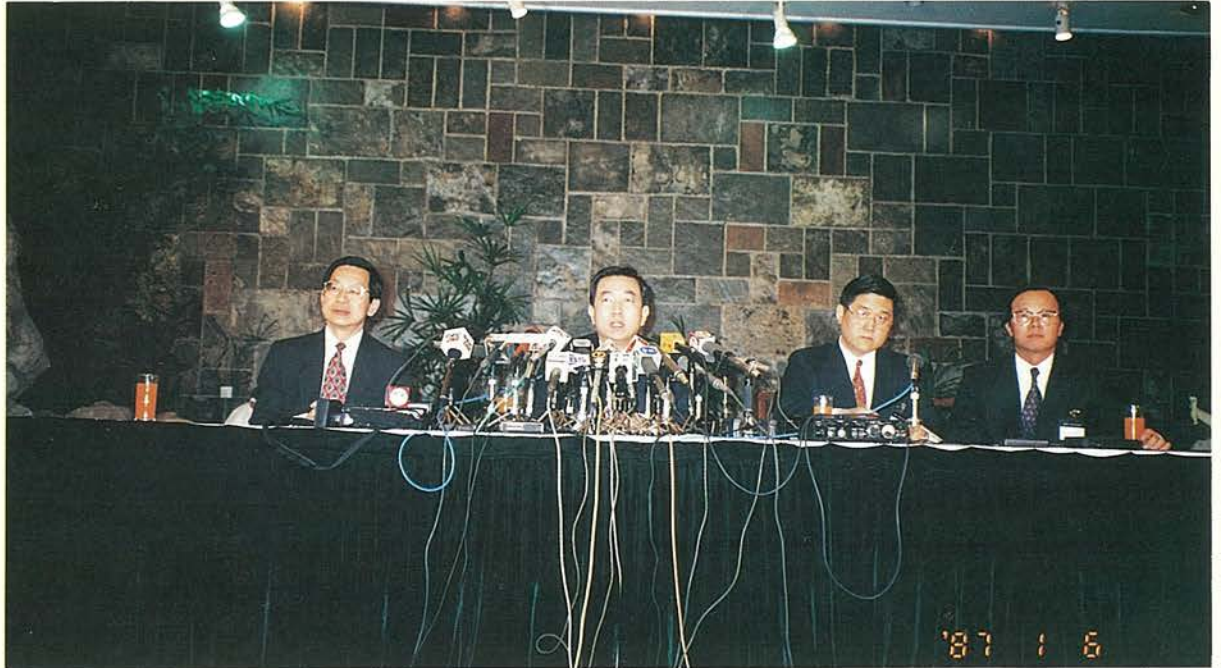
焦副董事長於會談後 發表會談成果。