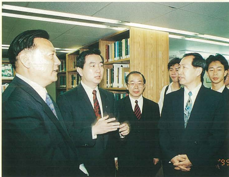
海協會一行參觀本會 資料室。