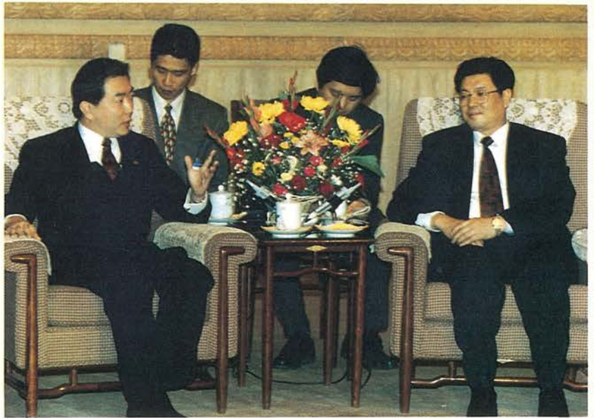
若干議題尚需再商議，列為待訂案件。