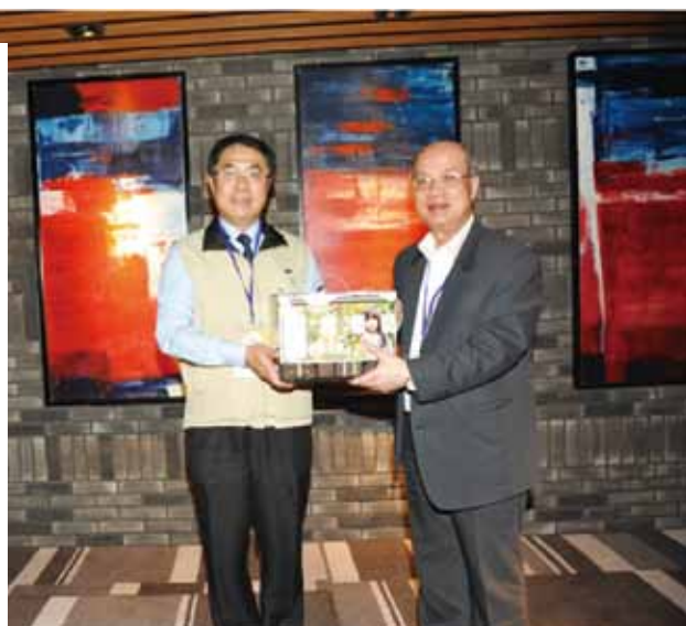
臺南市黃偉哲市長蒞臨晚宴致詞，並致贈伴手禮。