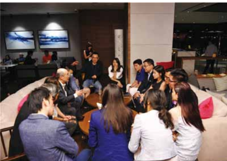
詹秘書長與臺青面對面交流

晚間舉行聯誼餐敘，臺南市黃偉哲市長特別撥冗蒞臨同歡，表達市府的歡迎與熱情。黃市長致詞時表示，未來臺南將成為人文與科技兼容發展的智慧城市，期待臺商看到臺南的潛力，到臺南投資。餐後，詹秘書長與臺青朋友再「續攤」，透過面對面交流，聆聽臺青的心聲以及對海基會及政府的各項建議。