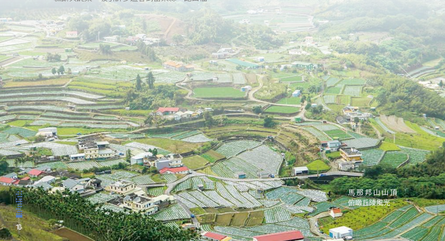
馬那邦山山頂 俯瞰丘陵風光。

縣內擁有大專院校包括：國立聯合大學、仁德醫護管理專科學校、育達科技大學，共計 3 所，每年可提供接近 1 萬人畢業生投入就業市場中。設置於縣內的研究機構則有台灣中油探採研究所、國立台灣工藝研究所苗栗工藝創意研究中心、台