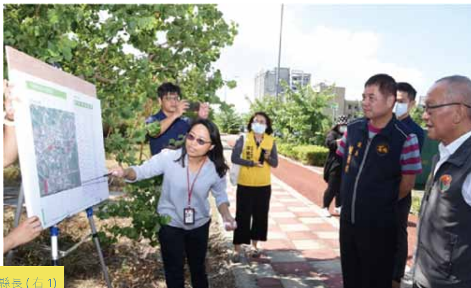
9月21日，徐耀昌縣長(右1)訪視台積電新廠投資案。