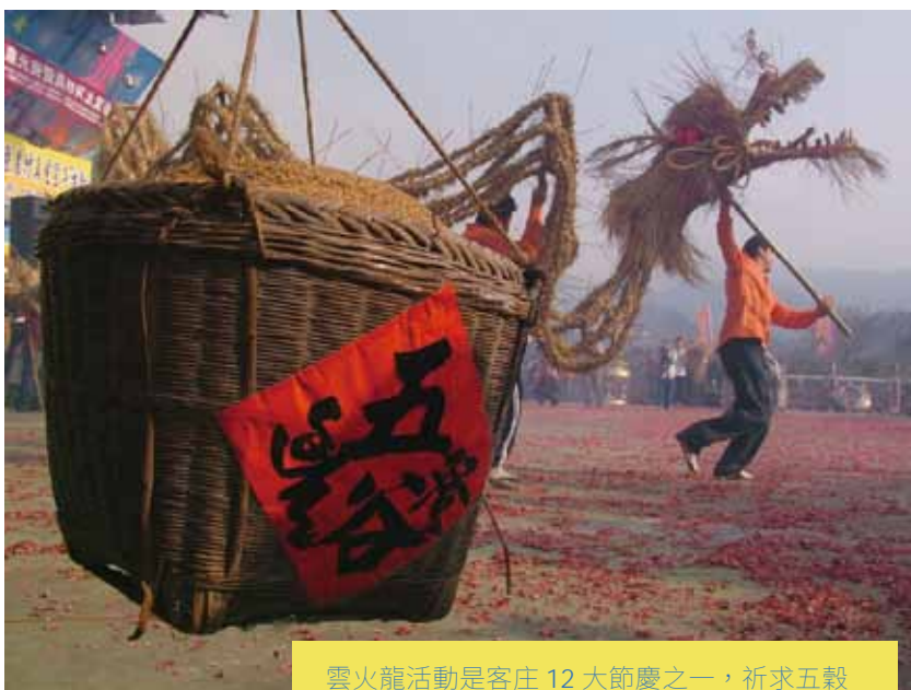
雲火龍活動是客庄 12 大節慶之一，祈求五穀豐收，國泰民安。

為回應青年創業就業需求，苗栗縣政府成立青年創業工坊，整合青年創業資源並提供創業諮詢與協助，同時導入任務型青年創業輔導顧問團，提供青年適時、適地、適性之服務。另為滿足青年創業之空間需求，縣府利用縣內閒置空間，於苗栗、竹南等地區建置青年創業基地，提供青年團隊進駐創業所需場域。