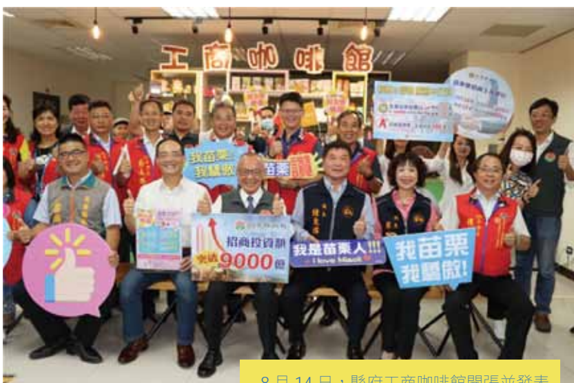
8 月 14 日，縣府工商咖啡館開張並發表招商成果。