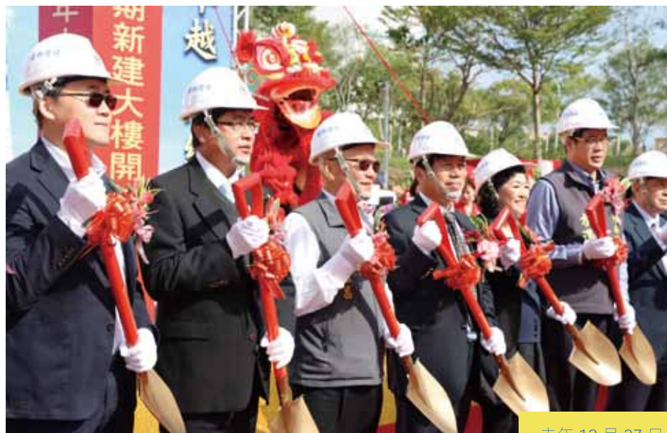
去年 12 月 27 日，聯嘉光電股份有限公司竹科新建第 2 期大樓動土典禮。

目前縣內的科技園區及工業區有：銅鑼工業區、竹南廣源科技園區、新竹科學工業園區竹南基地、銅鑼中興工業區、竹南工業區、頭份工業區等；另有開發中的新竹科學工業園區銅鑼基地，及規劃中的後龍科技園區與銅鑼中平工業區，另有依都市計畫興建的苑裡北區工業區與苑裡南區工業區。