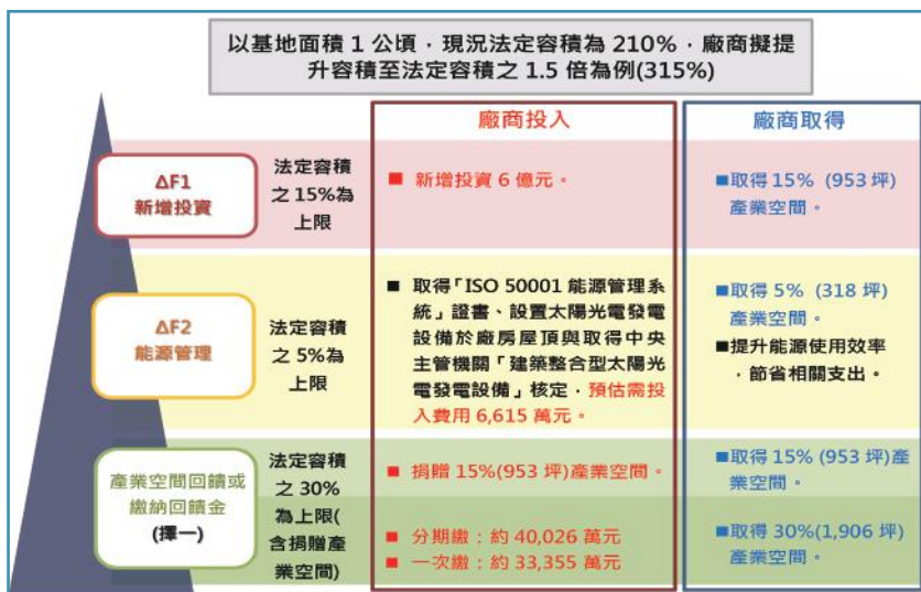
圖 2 容積獎勵項目及額度

產業園區外之興辦工業人因擴展工業或設置污染防治設備，需使用毗連之非都市土地時，可依「興辦工業人使用毗連非都市土地擴展計畫申請審查辦法」辦理。若遇有毗連特定農業區之情