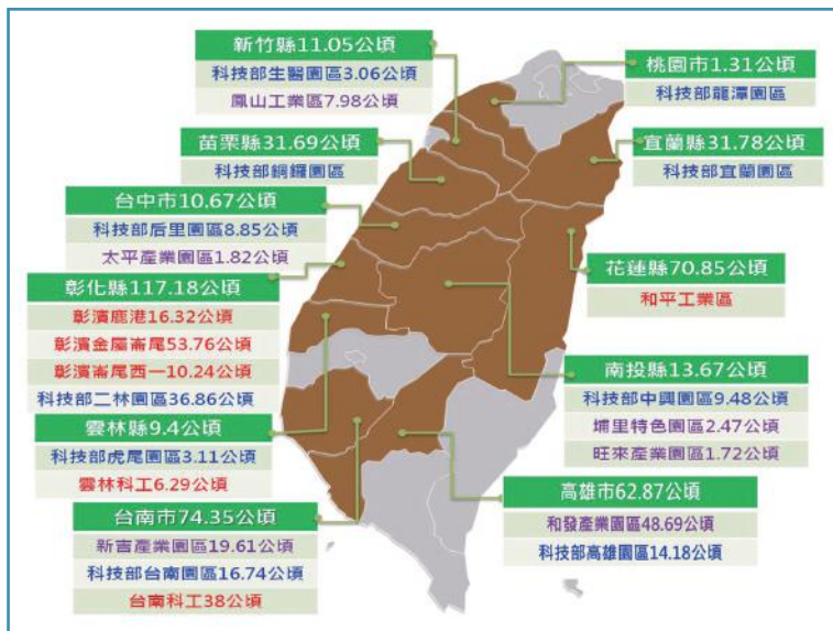
圖 3 目前可立即供給產業用地