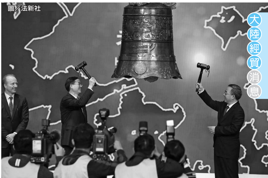
「滬港通」與「深港通」的先後啟動，對大陸A股納入MSCI提供一大助力。圖為2014年11月的滬港通開通典禮。

據人民日報5月29日報導，2017年北京國際服務貿易交易會於28日舉行。該會指出2016年，中